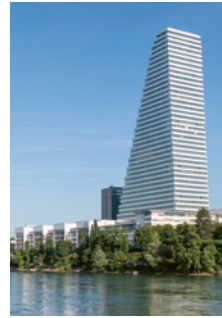
Eröffnung Roche-Turm Bau 1, höchstes Haus der Schweiz

Wirtschaftskrise und höchste Arbeitslosenquote