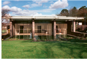
Eröffnung des Kunstmuseums Fondation Beyeler in Riehen