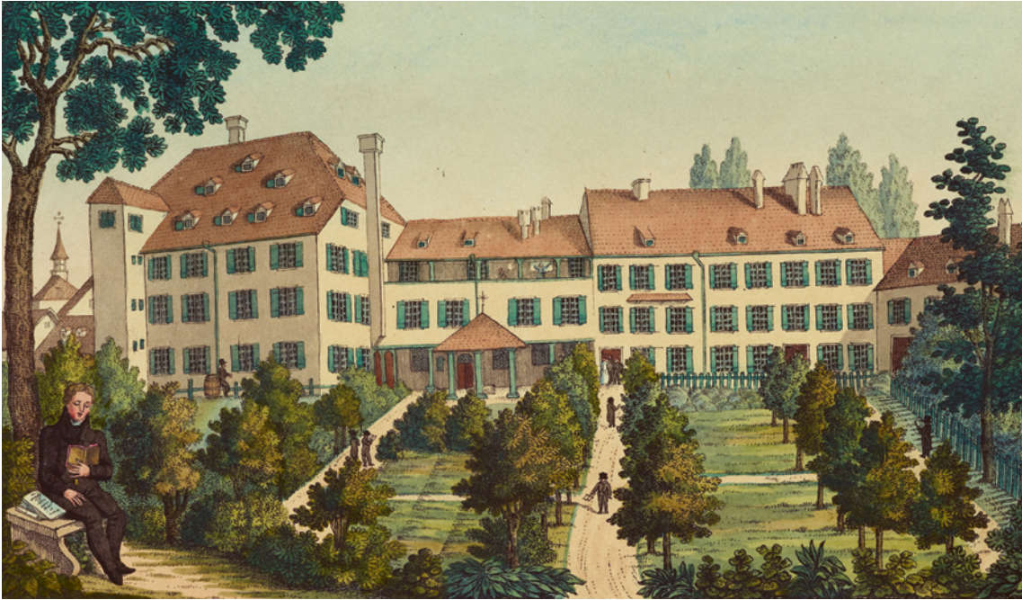
78 «Das Missions-Haus zu Basel», anonymer kolorierter Stich, undatiert. — Das Bild zeigt die Gartenanlage des ab 1820 genutzten ersten Hauses der Basler Mission in der Nähe der Kirche St. Leonhard. 1860 wurde das Gebäude durch einen Neubau an der Missionsstrasse ersetzt. Die intensive geistliche Lektüre der Missionare wird in der Darstellung dadurch herausgestrichen, dass die meisten Personen in der Gartenanlage eine Schrift in der Hand halten, die sie lesen oder memorieren.

jährigen irdischen Heilszeit unter der Herrschaft des wiedergekommenen Christus ausgeht, entfachte eine hohe Religionsproduktivität. Diese zeigte sich exemplarisch an den zahlreichen, neu entstehenden religiösen Vergemeinschaftungen in Basel. Da viele fromme Basler und Baslerinnen glaubten, man könne das Kommen des Reiches Gottes beispielsweise durch pädagogische, publizistische oder missionarische Massnahmen beschleunigen, schufen sie die erwähnten «Reich-Gottes-Werke». Dabei waren sie von dem «Postmillenarismus» getragen, der in der ersten Hälfte des 19. Jahrhunderts im «frommen Basel» vorherrschte. Diese ebenfalls endzeitliche Vorstellung geht erstens davon aus, dass der Beginn des Tausendjährigen Reiches vor der Wiederkunft Christi erfolge. Zweitens ist mit diesem Konzept die