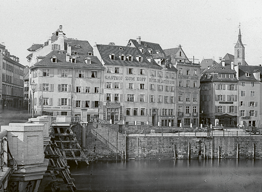
76 Ansicht der Schiffflände mit St. Peter in der Ferne. Foto: Foto Wolf, um 1872. — Im Vordergrund ist links die alte Rheinbrücke zu sehen, die auf der Grossbasler Seite auf Holzpfeiler abgestützt war. Oberhalb der Schiffflände befinden sich der Gasthof zum Goldenen

Kopf und der Gasthof zur Krone. Links öffnet sich die Eisengasse, rechts die Kronengasse. Der frühneuzeitliche Baubestand samt alten Strassenverläufen blieb noch bis zur Quartiersanierung der Jahrhundertwende erhalten.