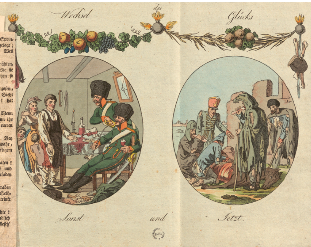
28 Bilderfolge «Wechsel des Glücks», eingeklebt in einen Band des «Ratsherrenkastens» von Emanuel Burckhardt-Sarasin, 1814. — Die napoleonischen Feldzüge führten zur Einquartierung französischer Truppen in weiten Teilen Europas. Nach dem katastrophal gescheiterten Russlandfeldzug von 1812 und mit dem Beginn der «Befreiungskriege» 1813

mussten Napoleons siegesgewohnte Armeen aus den zuvor eroberten Gebieten flüchten. Der «Wechsel des Glücks» karikiert die Entwicklung: Französische Soldaten in Sachsen fordern übermütig, drohend und masslos Bewirtung, später können sie, verarmt und zerlumpt, nur durch den – eigentlich tabuisierten – Verzehr von Pferdefleisch überleben.