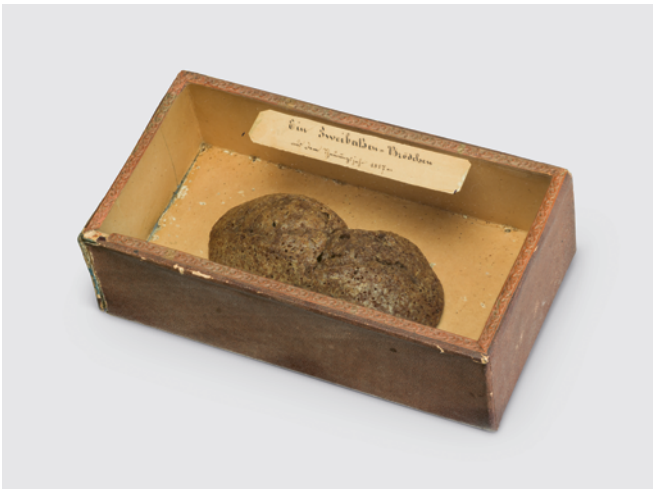
↑ 29 Erinnerungsmedaille auf die Hungerkrise, Nürnberg 1816/17. | ← 30 Basler Zweibatzten-Brötchen («Hungerbrötchen») aus dem Hungerjahr 1817. — Erinnerungsojekte forderten zur Dankbarkeit dafür auf, dass die Hungerkrise überstanden war. Zur Erinnerungsmedaille gehören acht Papiere, die die verheerende Witterung und den Brotmangel ebenso beschreiben wie die Freude und Dankbarkeit über eine reiche Ernte. Im Etuideckel ist eine Tabelle mit den höchsten Basler Marktpreisen für verschiedene Waren im Zeitraum 1816/17 eingeklebt. Auch «Hungerbrötchen» dienten als Erinnerungsojekte und veranschaulichten durch ihre geringe Grösse den Preisanstieg von Getreide.