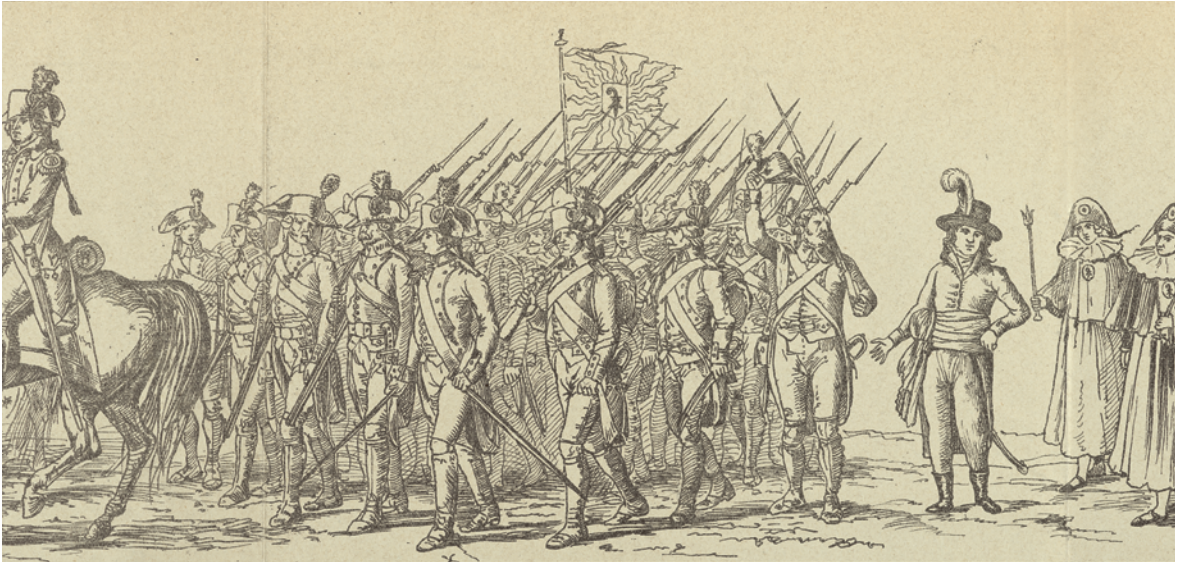
32 Zugsformation «Revolution 1798 vereinigte Spahlemer» an der Basler Fasnacht, anonyme Lithografie (Detail), 1898. — Die Clique inszenierte einen historisch aufwendig rekonstruierten Zug, der den Ausbruch der Basler Revolution 1798 zum Thema hatte. In diesem Ausschnitt ist neben anderen Figuren auch «Zunftmeister Ochs» in der helvetischen Amtstracht zu sehen. Die Formation folgte der bildlichen Überlieferung von 1798 und zeigte auch den Freiheitsbaum des Münsterplatzes mit dem Freiheitshut daran.

bildet die 1952 publizierte Dissertation von Andreas Staehelin mit dem Titel «Peter Ochs als Historiker», die aber hinsichtlich Charakterisierung und historischer Einordnung dieser Schlüsselfigur die gängigen negativen Stereotypen wiederholte. 106