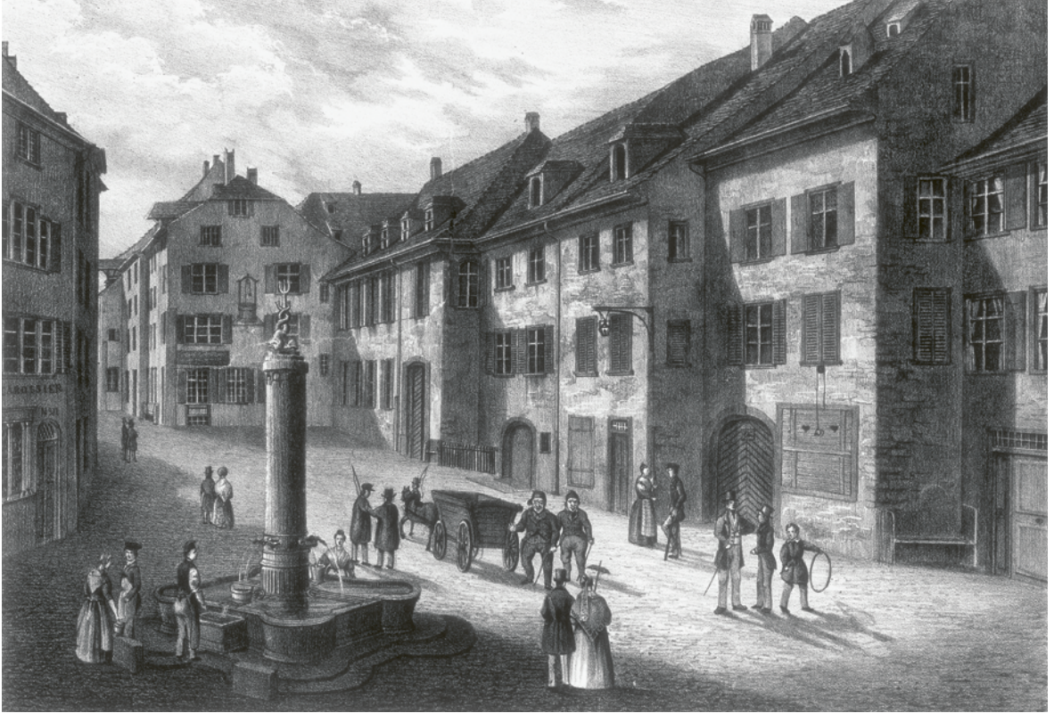
25 ‹Das alte Spital zu Basel›, Lithografie von H. Maurer, wahrscheinlich nach 1842. — Das Bild zeigt die Freie Strasse mit dem bis 1842 dort befindlichen, umfangreichen Spitalkomplex, der aus mehreren benachbarten Häusern bestand. Die mittelalterlichen Räumlichkeiten wurden zugunsten neuer im Markgräflerhof an der ‹Neuen Vorstadt› (Spitalstrasse) aufgegeben. ‹Niggi›

Münch und ‹Boppi› Keller sind hier in ihrer gängigen Darstellung als Paar zu erkennen (rechts neben dem Fuhrwerk). Sie waren Spitalpfründer und gehörten nicht zu den im ‹Almosen› Eingeschlossenen. Münch und Keller schauen als Einzige aus dem Bild heraus und sind damit als prominente Figuren der Basler Strassenszenerie hervorgehoben.