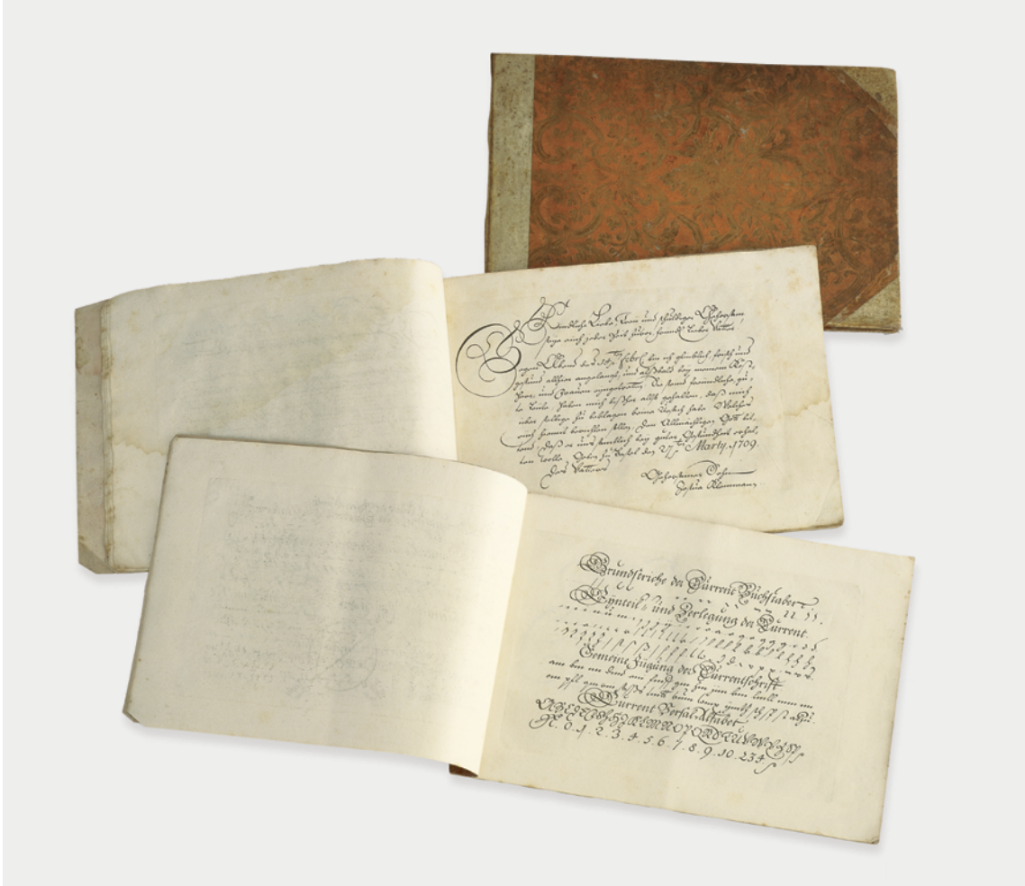
22 «Grund-Riß der Schreibkunst», Unterrichtswerk von Johann Jacob Spreng, 1707 (?) . — Spreng war Schreiblehrer am Basler Gymnasium. Seine Instruktionen und Vorlagen wurden über Generationen weitergegeben. Das hier gezeigte Exemplar ist wahrscheinlich von 1707 und hat einen Besitzereintrag von 1771. Es enthält auch Formbriefe für Neujahrsgüsse oder Gesundheitswünsche.

oder Cousins untereinander schrieben. Dieser Eindruck entsteht besonders dann, wenn in französischer Sprache korrespondiert und daher auch unter Teenagern gesiezt wurde.