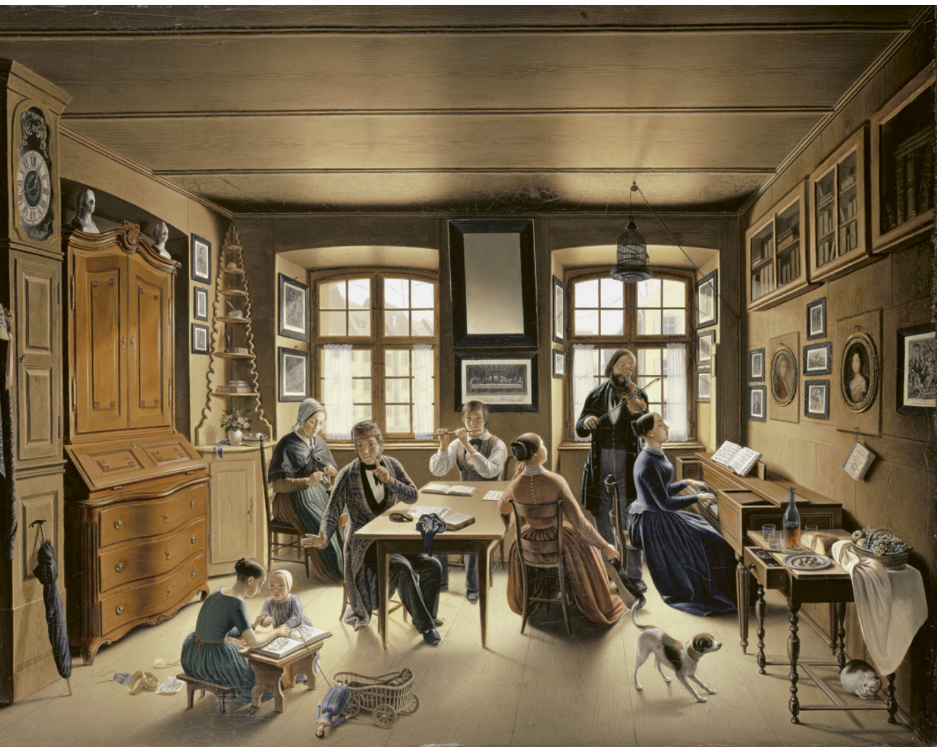
13 Basler Familienkonzert, Gemälde von Sebastian Gutzwiller, 1849. — Das Gemälde zeigt vermutlich Gutzwillers eigene Familie. Das zentrale Thema ist die generationenübergreifende familiäre Intimität mit Musik, Handarbeit und Spiel. Dienstpersonal, das in Basler Haushalten üblich war und die Stadt zu Tausenden bevölkerte, wäre in dieser idealisierenden Darstellung als störend empfunden worden.