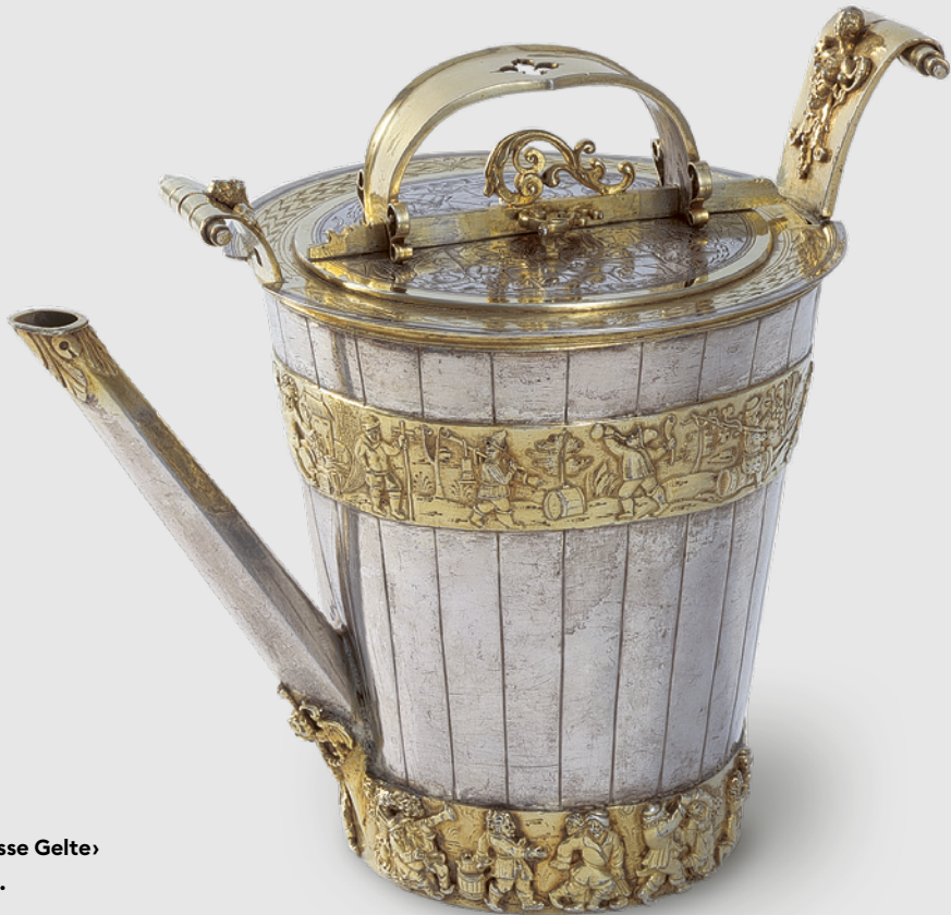
24 Hans Lüpold, Die «Grosse Gelte» der Weinleutenzunft, 1613.

Form des repräsentativen Trinkgefässes das Zunftwappen der Weinleute auf: Die Gelte war ein geeichtes Gefäss, mit dem das «Wein-umgeld» bemessen wurde, die wichtigste von der Herrschaft erhobene Konsumsteuer. Die Kontrolle über die Ablieferung des Umgelds lag bei der Weinleutenzunft. In einem Zunfthaus mit prächtiger Renaissancefassade am Kornmarkt ansässig, gehörten ihr unter anderem wohlhabende Weinhändler an. 59