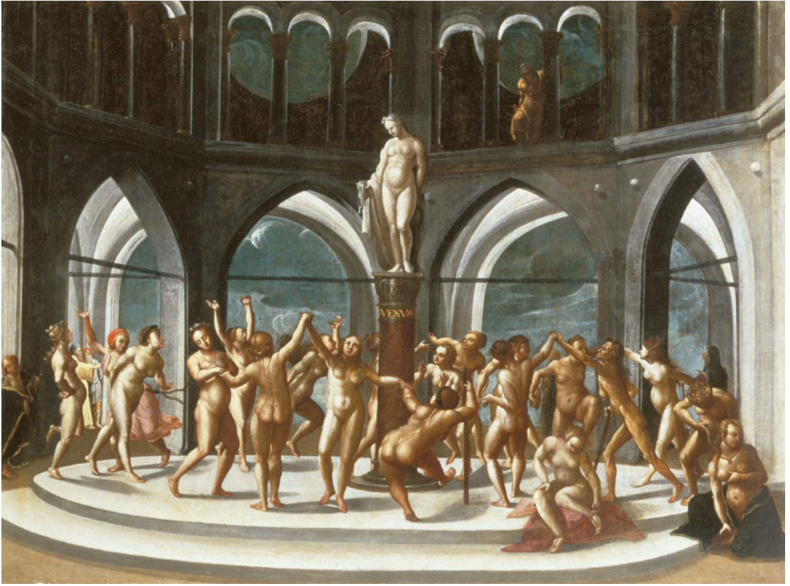
22 Hans Bock d. Ä., «Venustanz», 1580/1590. — Im «Venustanz» inszenierte Hans Bock mythologische Figuren in einem Kirchenraum, der an das Innere des Basler Münsters erinnert.

übersetzte und Programme schuf, die auf die humanistische Bildung der Hausbewohner anspielten und diese im öffentlichen Raum widerspiegeln. 50