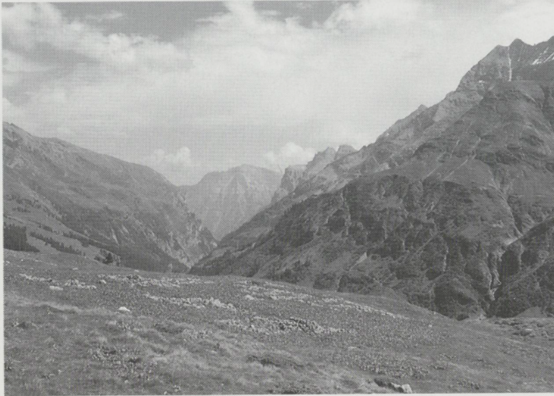
Abb. 1: Wüstungsplatz Rothusboden/ Calfeisental (Kanton St. Gallen). Das abgelegene Hochtal wurde anfänglich nur temporär genutzt, bis um 1300 deutschsprachige Walser Dauersiedlungen errichteten. Die Wüstung Rothusboden stammt vermutlich noch aus der Zeit vor der Ankunft der Walser.

läufig über ganze Landstriche erstreckt, stossen wir in den Alpen auf eklatante, kleinräumige Gegensätze in der Bodengestalt, im Klima, in der Ertragsfähigkeit des Erdreichs. Die weitläufigen Hochgebirgsregionen mit ihrem unproduktiven Fels, Schnee und Eis werden von tiefeingeschnittenen Tälern durchzogen, in denen – wenn auch meist auf schmalen Flächen – für Ackerbau, Reb- und Obstbau und eine vielseitige Viehhaltung geradezu ideale Bedingungen herrschten: Zwischen den Palmen und Reben im Bleniotal und dem ewigen Schnee des Rheinwaldhorns liegen nur 5 Luftlinienkilometer!