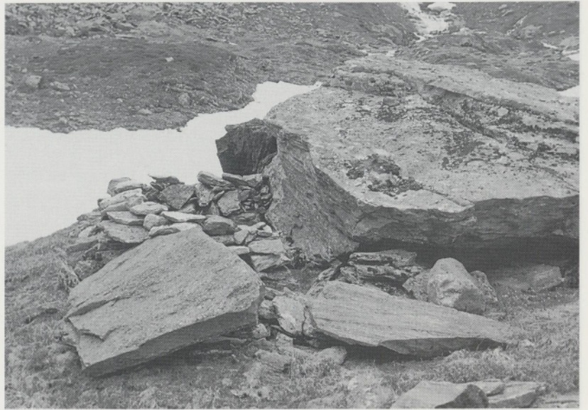
Abb. 6: Reste eines einfachen Unterstandes auf der Alp Guspis ob Hospental (Kanton Uri).

Die Marginalität der alpinen Vieh- und Milchwirtschaft ist archäologisch in den mittelalterlichen Siedlungsplätzen zu fassen, deren Reste sich in grosser Zahl auf Höhen zwischen 1500 und 2500 m ü. M. erhalten haben. Diese Spuren in Form von zerfallendem Trockenmauerwerk, oft als Heidenhüttli bezeichnet, haben schon im 18. Jahrhundert wissenschaftliche Beachtung und abenteuerliche Deutungen erfahren. Erste Anläufe zu ihrer archäologischen Erforschung sind im 19. Jahrhundert versucht,