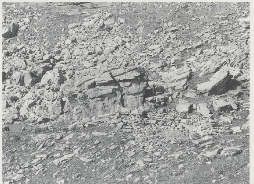
Abb. 7: Wüstungsplatz Müllerenhütte/Melchsee-Frutt (Kanton Obwalden). Reste einer Alphütte am unteren Rand eines schützenden Bergsturzfächers.

aber wegen vermeintlicher Ergebnislosigkeit wieder abgebrochen worden. Seit etwa 30 Jahren wird in verschiedenen Alpenländern (Schweiz, Österreich, Frankreich, Slowenien) mit Erfolg auf solchen hochgelegenen Siedlungsplätzen gegraben, so dass mittlerweile die Umrisse dieser alpinen Marginalkultur recht deutlich fassbar geworden sind (Abb. 5). Als archäologisch besonders aufschlussreich erweisen sich die verlassenen Siedlungsplätze, die ‚Alpwüstungen‘, während auf den noch benutzten Stäfeln Bauten aus neuerer Zeit die Befunde im Boden mehrheitlich zerstört haben. In der Verteilung der Wohnplätze (Stäfel) über die Landschaft spiegelt sich die hochalpine Siedlungsfeindlichkeit: Pro Alp – im Sinne einer sommerlichen Nutzungseinheit von durch-