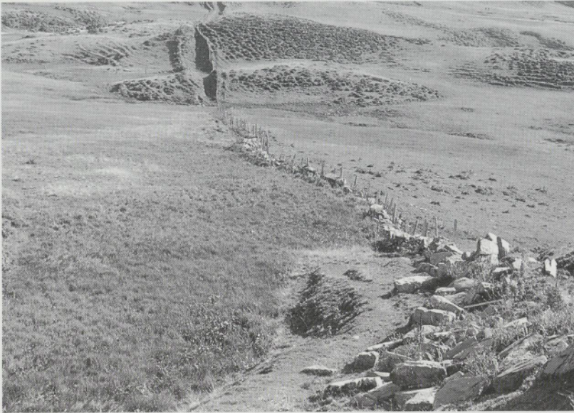
Abb. 4: Grenzmauer auf Melchsee-Frutt (Kanton Obwalden). Markierung einer schiedsgerichtlich vereinbarten Grenzlinie.

versorgung. Die wenigen Ertragsüberschüsse gingen als herrschaftliche Naturalsteuern weg oder sie dienten zur Beschaffung lebensnotwendiger Güter (z. B. Salz, Metallgeräte). Ergänzt wurde die Eigenproduktion durch sammelwirtschaftliche Tätigkeiten. In den südlichen Alpentälern galt die Kastanie als Grundnahrungsmittel. Jagd und Fischfang konnten unter obrigkeitlicher Kontrolle betrieben werden, desgleichen die Suche nach Bergkristallen. In weiten Teilen des Alpenraumes (Graubünden, Veltlin, Tessin, Ursern, Wallis) bildete die Gewinnung und Verarbeitung von Speckstein eine wichtige Möglichkeit des Haupt- und Nebenerwerbs (Abb. 3), während der Metallbergbau nur in wenigen Tälern (Silber im Unterengadin, Eisen am Gonzen) eine nen-