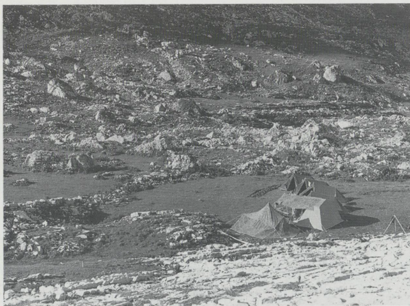
Abb. 5: Biwak auf der Wüstung Spilblätz/Charetalp (Kanton Schwyz).

nenswerte Rolle spielte. Salzvorkommen waren vor dem 16. Jahrhundert im ganzen Gebiet der Schweiz unbekannt. Dieser weitgehende Mangel an Montangütern dürfte die Marginalität und Randständigkeit des Schweizer Alpenraumes im Mittelalter zweifellos mitgeprägt haben.