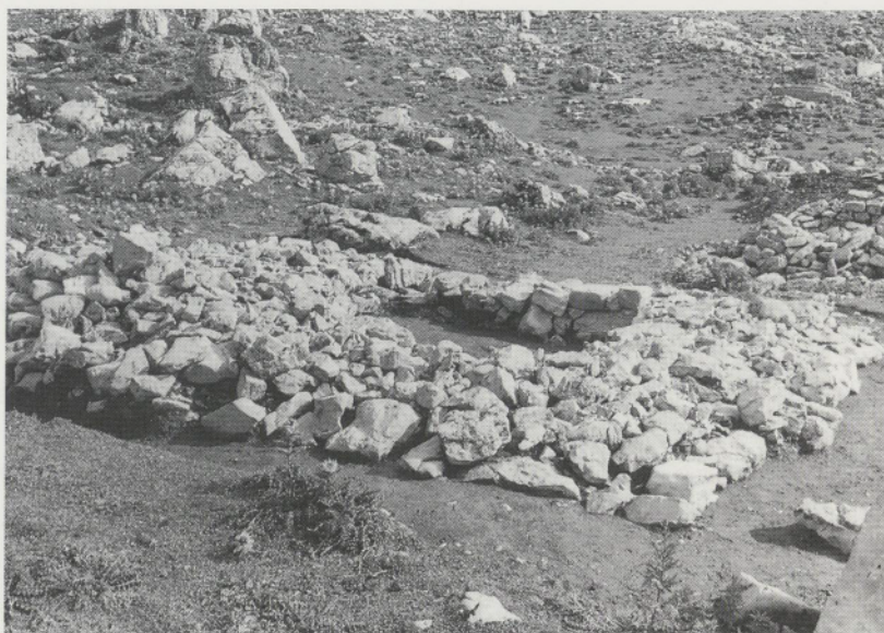
Abb. 9: Weitgehend abgetragener Grundriss einer quadratischen Hütte auf der Wüstung Spilblätz/Charetalp (Kanton Schwyz). Die über 2 m starke Mauer lässt auf einen Oberbau mit Kraggewölbe schliessen.

Man mag sich fragen, worin der Wert aufwendiger archäologischer Untersuchungen auf so ärmlichen Siedlungsplätzen mit dermassen kümmerlichen Kleinfunderwartungen bestehe. Die Frage ist falsch gestellt und geht von überholten Vorstellungen über die wissenschaftlichen Aufgaben der Archäologie aus. So wenig die heutige Geschichtsforschung sich nur mit Taten der Mächtigen und den vermeintlichen Grossereignissen der Vergangenheit (deren Tragweite ohnehin oft überschätzt wird) befassen darf, so wenig soll sich die Archäologie auf die Ausgrabung wirtschaftlicher und kultureller Zentren mit reichem Fundmaterial beschränken. Auch siedlungsfeindliche Marginalzonen haben ihre Geschichte (die oft nur archäologisch zu fassen ist), die zum Verständnis der Vergangenheit eines Siedlungs- und Kulturraumes ebenso unverzichtbar ist wie die Kenntnis über die Baugeschichte einer Kathedrale oder einer Königspfalz. Wer die mittel-