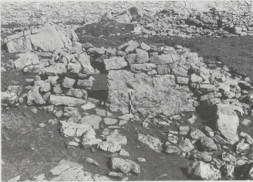
Abb. 8: Reste einer Hüttenfassade auf der Wüstung Spilblätz/Charetalp (Kanton Schwyz). Gut erkennbar der schmale Eingang und der natürliche, in die Mauer einbezogene Felsblock (wohl 11. Jahrhundert).

schnittlich 2–5 Quadratkilometern Weidefläche – finden sich etwa zwei bis vier Siedlungsplätze, die in der Regel aber nicht gleichzeitig, sondern in jahreszeitlicher Abfolge hintereinander benutzt wurden. Die Wohnbauten der einzelnen Stäfel – bei Ausgrabungen an den Feuerstellen erkennbar – bestehen aus Einraumhäusern, den ‚Alphütten‘, mit einer Innenfläche von 5 bis 10 m 2 , was kaum mehr als zwei bis maximal drei Leuten Platz bot. Manche Stäfel weisen nur eine einzige Hütte auf, andere zeigen in unterschiedlich dichter Streuung Gruppen mit bis zu einem Dutzend bewohnbarer Bauten. Als Lagerräume für Milch, Milchprodukte und sonstige Vorräte sind überdachte, in den Hang getriebene Bauten zu deuten, desgleichen Höhlen ( Balmen ) unter Sturzblöcken. Gelegentlich sind solche Höhlen auch zu Wohnzwecken hergerichtet worden, besonders häufig im Val Bavona ( splüi/sprügh < lat. spelunca ).