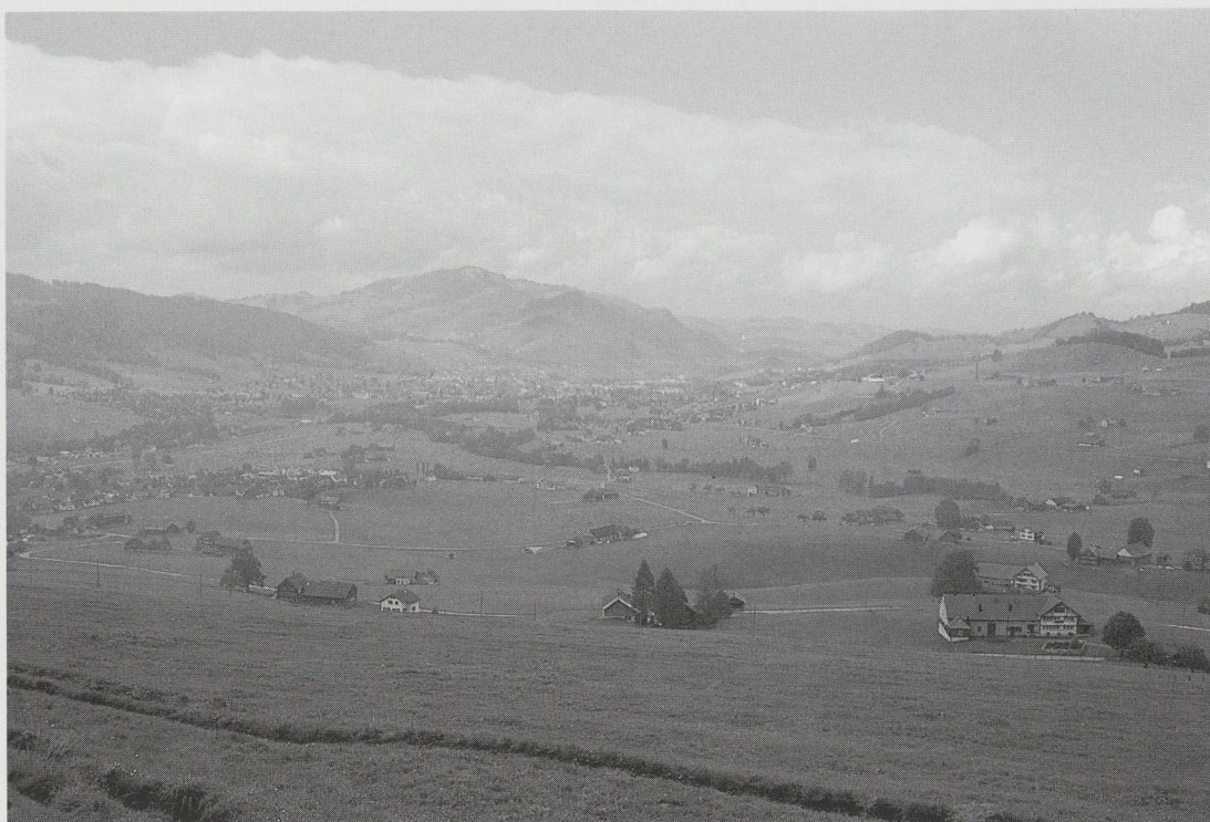
Abb. 1: Talkessel von Appenzell mit Hauptort. Überblick (von Südosten), in der rechten Bildhälfte Burgstelle Schönenbüel (weisses Grabungszelt in der Nähe des Sendemasten) und am rechten Bildrand im Hintergrund der Burghügel der Burgruine Clanx.

für den Kanton Appenzell I. Rh. Die Region, wie auch grosse Teile der Ostschweiz, sind archäologisch schlecht erforscht. Aufgrund der obengenannten geographischen Geschlossenheit und der starken Traditionsverbundenheit bietet die Region aber, insbesondere der zentrale Talkessel mit dem Hauptort Appenzell, alle Voraussetzungen einer klassischen Siedlungszelle (Abb. 1). Sie beinhaltet spannende Fragestellungen und verspricht eine gute Ausgangslage zu deren Klärung. So wurde im Jahre 2000 durch die Erziehungsdirektion des Kantons Appenzell I. Rh. beim Schweizerischen Nationalfonds ein Forschungsprojekt eingegeben und bewilligt. Die Ergebnisse sollen im Zusammenhang mit dem 600-Jahr-Jubiläum der Schlacht am Stoos (1405) in den Schweizerischen Beiträgen zur Kulturgeschichte und Archäologie des Mittelalters (SBKAM) des Schweizerischen Burgenvereins publiziert werden.