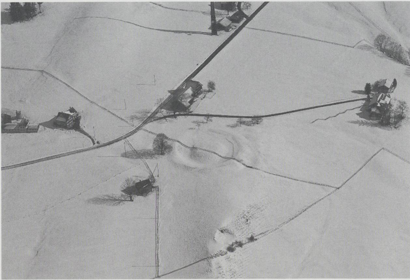
Abb. 3: Burgstelle Schönenbüel. Luftaufnahme im Winter 2000/2001 von Norden.