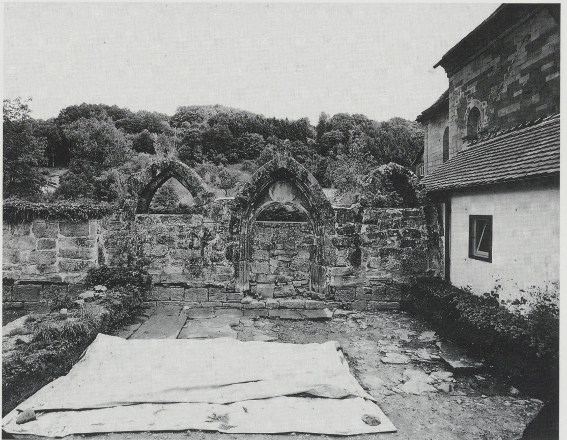
Abb. 4: Gnadental, ehem. Kreuzgang. Einzige noch stehende, allerdings mehrfach veränderte Wand des Ostflügels (LDA).