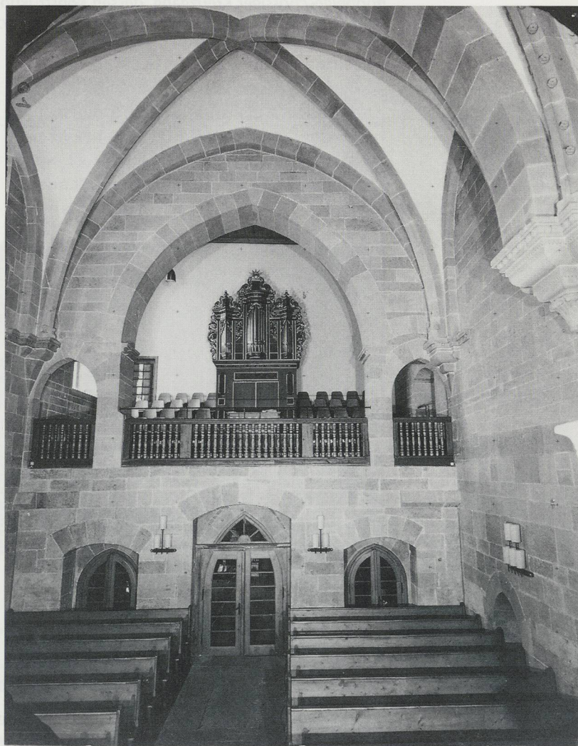
Abb. 2: Gnadental, Klosterkirche. Blick auf die Trennwand zwischen östlichem Langhaus und westlicher Empore.

Hier deuten sich in der Verwendung der Baumaterialien und in der Art der Ausführung bereits Klausurstufen an: Während man nach außen den Klausurbereich baulich massiv abschirmte, waren die einzelnen Bauteile innerhalb der Klausur oftmals weniger stark getrennt. Im Zusammenhang mit der Errichtung des Ostflügels im Verlauf des 14. Jahrhunderts entstand auch der zweigeschossige Kreuzgang an