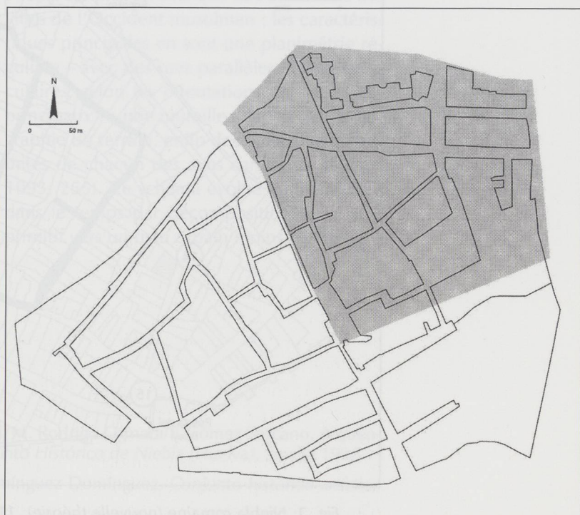
Fig. 1: Niebla romana (version ancienne).

na asociado a una potente estructura muraria de dirección aproximada SE-NO « (Campos/Rodrigo/Gómez 1996, 194 ; 247 n° 13), c'est-à-dire le mur suit le tracé de la limite orientale du carré.