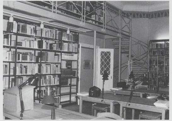
Abb. 3: Bibliothek des Europäischen Burgeninstituts – Lesesaal.

nur als Bodendenkmäler erhaltenen Burgenreste, da nur eine vollständige Erhebung auch kulturhistorische und siedlungsgeschichtliche Rückschlüsse erlaubt. Die Verwendung der leistungsstarken und dennoch erschwinglichen Datenbank ACCESS soll das Projekt für möglichst viele Mitglieder zugänglich machen. Nach einer praktischen Erprobung am Beispiel der Inventarisierung der Burgen in Rheinland-Pfalz und der Einarbeitung der dabei gewonnen Erkenntnisse, sollen sich jetzt die in Landesgruppen organisierten Mitglieder der Deutschen Burgenvereinigung an der Inventarisierung beteiligen. Hierzu liegen bereits umfangreiche Vorarbeiten vor. Parallel dazu sollen in enger Zusammenarbeit mit den Landesämtern für Denkmalpflege die dort schon vorhandenen Daten in das geplante Gesamtinventar eingearbeitet werden. Die Datenkontrolle liegt dabei in der Hand des EBI. Für die Zukunft ist an eine Internetnutzung der Daten und somit die Zugänglichkeit für