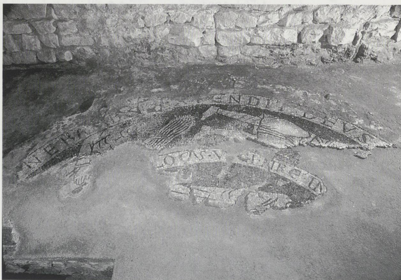
Abb. 3: Nördliches Viertel des Mosaikaußenfeldes mit der Opferszene; im Vordergrund Bruchstücke der rekonstruierten Inneninschrift und des Mittelfeldes.

Abb. 2: Östliche Hälfte des Mosaikmedaillons, in der Mitte Störung durch eine romanische Ausbruchgrube; im Vordergrund, am Rande des Medaillons, unterste Lage einer liturgischen Installation.