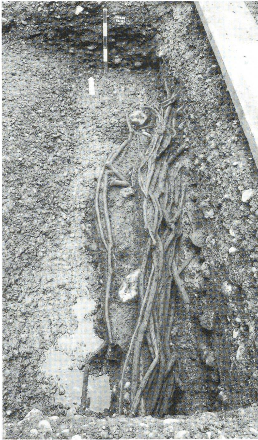
Abb. 3: Winterthur-Obergasse. Das Rutengeflecht bildete die seitliche Wand des Stadtbachs aus der Zeit um 1200, der rechts davon floss. Die Pfosten wurden bereits beim Zuschütten des Kanals entfernt (Foto: Kantonsarchäologie Zürich, Martin Bachmann).

lungsteil an einer Durchgangsstrasse – heben sich bereits von anderen ländlichen Siedlungen ab. Fassbar wird eine frühstädtische, aus zwei verschiedenen strukturierten Teilen bestehende Siedlung. Zudem lassen sich ein Wachstum der Siedlung und neue Bewohner erschliessen. Möglicherweise hatte der Ausbau