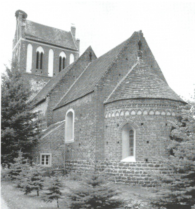
Abb. 2: Backsteinbasilika in Lindena (D, Brandenburg, Landkreis Elbe-Elster).

des Untersuchungsgebiets nicht mehr benutzt wurde, erst im Historismus entstanden backsteinerne Dorfkirchen.