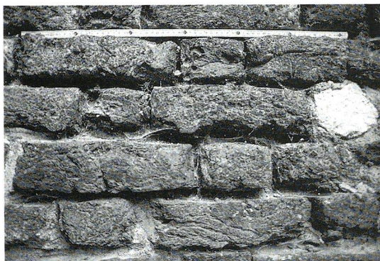
Abb. 4: Backsteinmauerwerk aus auffälligerweise gelbgrauen Steinen am sogenannten Sorbenturm in Eilenburg (D, Sachsen, Landkreis Delitzsch).

litzsch), Luckau (Brandenburg, Landkreis Dahme-Spreewald) und Prettin (Sachsen-Anhalt, Landkreis Wittenberg) zeigen.