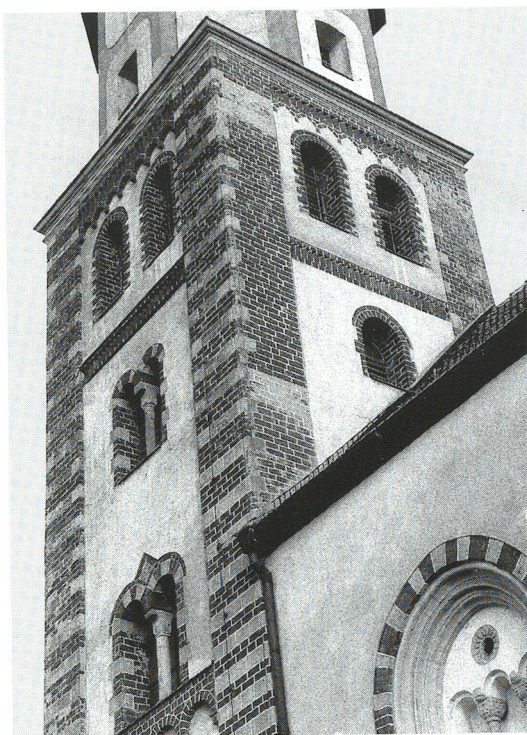
Abb. 3: Nordwestturm der Stadtkirche in Rötha (D, Sachsen, Landkreis Leipziger Land).

Die ältesten profanen Bauwerke aus Backstein im Untersuchungsgebiet stammen aus dem Bereich der adeligen Wehrarchitektur. Unter diesen Burgtürmen finden sich auffällig häufig Bergfriede. Während die Türme von Altenburg (Thüringen, Landkreis Altenburger Land), Leisnig (Sachsen, Landkreis Döbeln) und Rochsburg (Sachsen, Landkreis Mittweida) auf rundem Grundriss errichtet wurden, besitzt der Waldenburger Turm (Sachsen, Landkreis Chemnitzer Land) eine annähernd quadratische Grundfläche. (Siehe dazu Hoffmann 2001). Bei allen vier Bergfriede bestehen jeweils nur die oberen Geschosse aus Backstein, die unteren aus Haustein. In Leisnig und Waldenburg finden sich einzelne Buckelquader in den unteren Abschnitten. Die repräsentative Bedeutung, die Buckelquader besaßen lässt den Backstein in diesem Zusammenhang ebenfalls als nobles Baumaterial erkennen. Bergfriede mit Untergeschossen aus Naturstein in Kombination mit Backsteinaufbauten existieren im Untersuchungsgebiet nur im Bereich des königlichen Pleißenlandes. Jüngere Beispiele für die Verwendung von Backstein an Bergfriede sind die aus dem 13. Jahrhundert stammenden