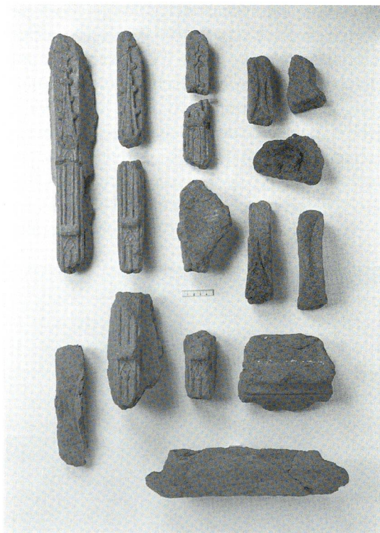
Abb. 3 Marburg (D), Schloss. Ofenlehmfunde aus dem kleinen Rittersaal. Links oben: Strebepfeiler mit Blindmasswerk und -fialen. Links unten und rechts oben: Rückseiten von Strebepfeilern mit Abdrücken runder Napfkacheln. Rechts unten: Gesimsprofile, eines mit Ecke.

Die erhaltenen Ofenlehmteile zeigen Teile eines profilierten Gesimses, eine Ecke von 135° (Achteck), senkrechte Leisten mit halbrundem Querschnitt und mehrschichtig aufgebaute Senkrechtleisten, die aufgrund ihrer Form als Strebepfeiler bezeichnet werden können. Die ‚Strebepfeiler‘ weisen aussen plastische Verzierungen auf, die als ‚Stockwerke‘ mit Blindmaßwerk und Kraggesimsen sowie als Blendfialen angesprochen werden können. Beidseitig der ‚Strebepfeiler‘ sind Ansätze des achteckigen Turmes mit Abdrücken der Napfkacheln erhalten (Abb. 3).