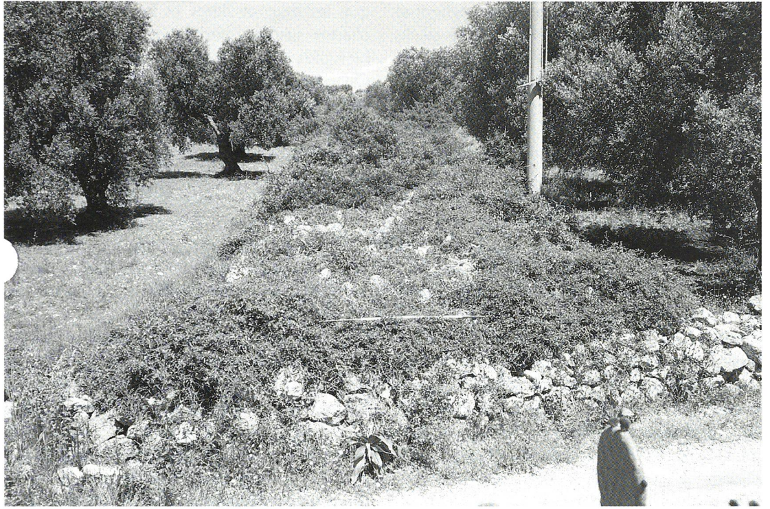
Fig. 2 ; 3 ; 4: Le paretone de Sava : trois vues sommitales (S-N).