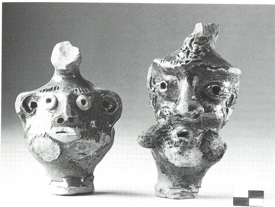
Fig. 2: Deux sifflets en forme de tête humaine en céramique. Walraversijde (Ostende, Belgique), XVe siècle.

que aux marchés des Pays-Bas Bourguignons, notamment à Sluis. La Hanse avait le monopole de ce produit typique de la Baltique. C'est à Sluis que les pêcheurs de Walraversijde se procuraient probablement des tonneaux d'origine balte. Ils les reutilisaient surtout comme structure de puits parce qu'un emploi dans le cadre de la production de poisson par exemple ce qui semblerait logique était probablement interdit. La cour Bourguignonne prenait au début du XVe siècle encore des mesures visant à réduire autant que possible la production locale de harengs en caque et à protéger en même temps maximale-ment le monopole hanséatique. Ce n'était qu'à partir des années trente du XVe siècle sous le régime de Philippe le Bon que les pêcheurs flamands avaient enfin réussi à expulser le hareng en caque dite de Schonen provenant du sud de la Suède actuelle du marché flamand (Unger 1978). Les dates d'abattage des tonneaux de Walraversijde correspondent exactement avec la période pendant laquelle la Hanse dominait le marché du hareng en caque. Comme par hasard la réutilisation de tonneaux comme structure de puits tombait en désuétude après les années trente du XVe siècle. Les archives du sol ont donc probablement enregistré de cette manière le monopole hanséatique sur le hareng en caque